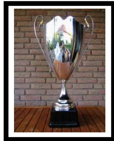
Der neue Mösle-Pokal

FC Tsch Tsch FC Tsch Tsch Soko Ost FC Tsch Tsch FC Tsch Tsch Youngsters No Name Youngsters Nicht zu Ende gespielt (Regen) Kein Turnier ausgetragen (Regen) Kein Turnier ausgetragen (Regen) Selecao Youngsters